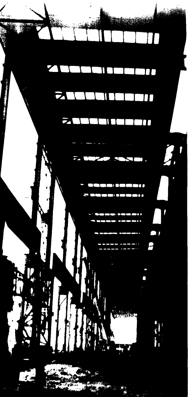
南山集团公司重钢结构工程

第三层，也是构成企业管理文化个性特征的主要一层。富煌通过制定供应、销售、财务等职能部门管理制度、综合办公管理制度、生产与作业管理制度、员工行为规范等约束建立了富煌的制度文化；精神层是富煌文化的骨髓结构，“祥和奉献、奋进创新、勇争一流、永不自满”是富煌精神的完美表达。富煌人在富煌精神的指引下和谐发展，富煌文化塑造人，富煌人培育发展富煌文化，最终达到人企合一的境界。